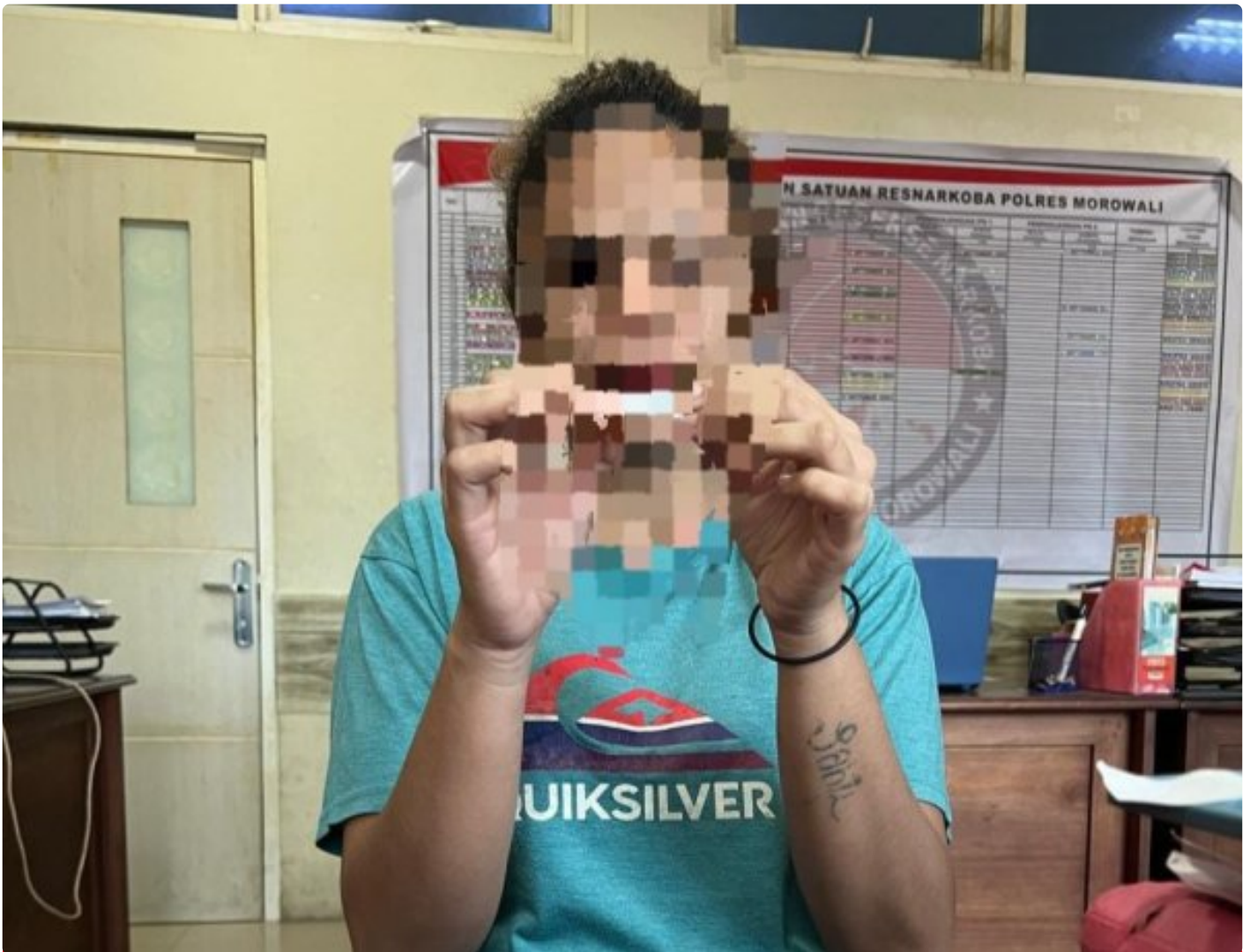
Pelaku Narkotika Seorang Perempuan di tangkap di bahodopi